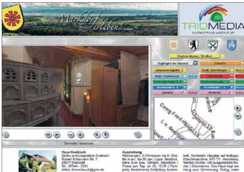
So soll das Portal aussehen, wenn es Ende November freigeschaltet wird.

Wir befördern Sie sofort zum Chef! Denn die Sparkassen-Finanzgruppe unterstützt mehr als die Hälfte aller Existenzgründungen in Deutschland und steht Ihnen als kompetenter Partner für die Planung und die Finanzierung Ihrer Firma gerne zur Seite. Mehr dazu in Ihrer Filiale oder unter www.sparkasse-bodensee.de .